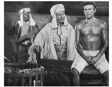
1966 LES AV. EXTRAORDINAIRES DE CERVANTES (Cervantes) de V. Sherman avec Horst Buchholz