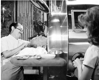
1976 LE BUS EN FOLIE (The big Bus) de James Frawley avec Bob Dishy, Stockard Channing