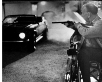
1976 CRASH ! (Akazza, the God of Vengeance) de Charles Band