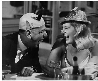
1965 LA NEF DES FOUS (Ship of Fools) de Stanley Kramer avec Christiane Schmidtmer