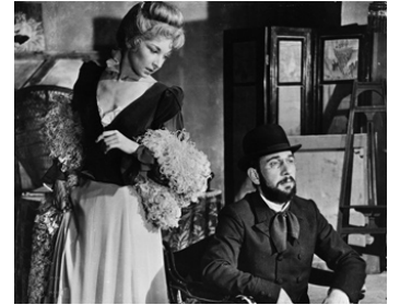
1952 MOULIN ROUGE (Moulin Rouge) de John Huston avec Colette Marchand