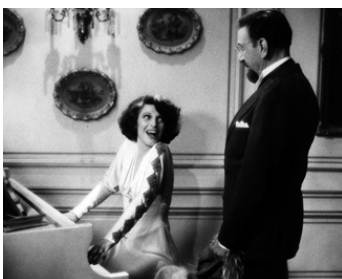
1983 ÊTRE OU NE PAS ÊTRE (To be or not to be) d'Alan Johnson avec Anne Bancroft