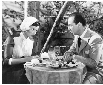
1949 LE MYSTÉRIEUX DOCTEUR KORVO (Whirlpool) d'O. Preminger avec Gene Tierney