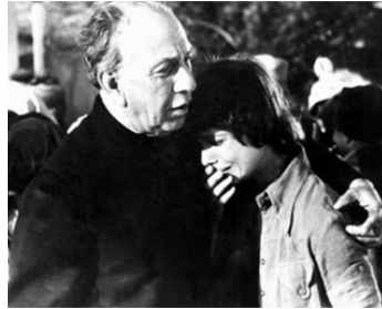
1975 LES ORPHELINS DU BON DIEU (Forever young, forever free) d'A. Lazarus avec Karen Valentine