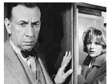
1963 LE TRAIN DE BERLIN S'EST ARRÊTÉ de Rolf Haedrich avec Nicole Courcel