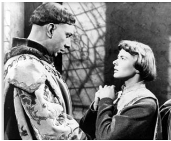
1948 JEANNE D'ARC (Joan of Arc) de Victor Fleming avec Ingrid Bergman