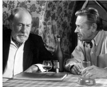
1977 FEDORA (Fedora) de Billy Wilder avec William Holden