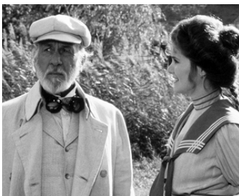
1981 COMÉDIE ÉROTIQUE D'UNE NUIT D'ÉTÉ de Woody Allen avec Julie Hagerty