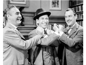
1954 AU FOND DE MON CŒUR (Deep in my Heart) de S. Donen avec Jim Backus, Douglas Fowley