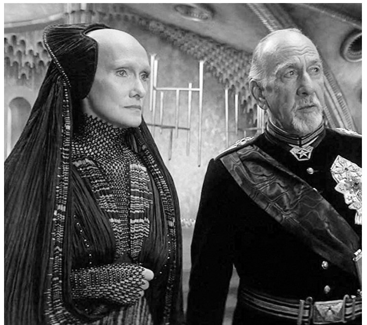
1984 DUNE (Dune) de David Lynch avec Sian Phillips