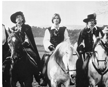
1977 LE 5 E MOUSQUETAIRE (The fifth Musketeer) de Ken Annakin avec Beau Bridges, Cornel Wilde