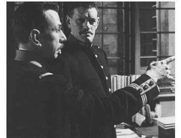
1957 L'AFFAIRE DREYFUS (l'accuse !) de José Ferrer avec Harry Andrews