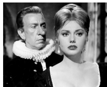
1963 CYRANO ET D'ARTAGNAN d'Abel Gance avec Sylva Koscina