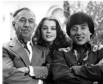
1980 LE CHINOIS (The big Bralw) de Robert Clouse avec Kristine Debell, Jackie Chan