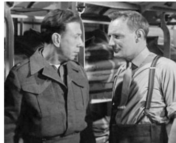
1955 COMMANDO DANS LA GIRONDE (The Cockleshell Heroes) de J. Ferrer avec T. Howard