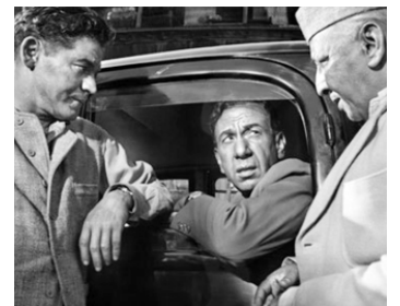
1962 À 9 HEURES DE RAMA (Nine hours to Rama) de M. Robson avec F. Matthews, D. Abraham