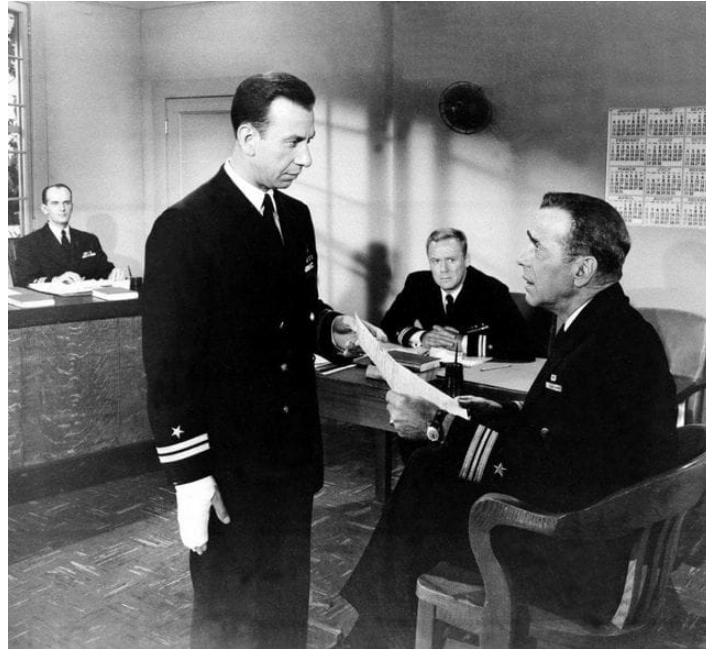
1954 OURAGAN SUR LE CAINE (The Caine Mutiny) d'E. Dmytryk avec Van Johnson, Humphrey Bogart