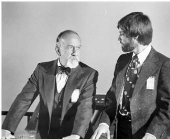
1978 L'INÉVITABLE CATASTROPHE (The Swarm) d'Irwin Allen avec Richard Chamberlain