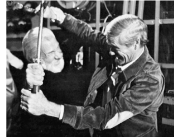
1977 THE AMAZING CAPTAIN NEMO d'Alex March avec Mel Ferrer