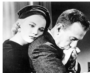
1958 L'AMOUR COÛTE CHER (The high cost of Loving) de José Ferrer avec Gena Rowlands