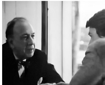
1979 ENNEMIS NATURELS (Natural Enemies) de Jeff Kanew avec Hal Holbrook