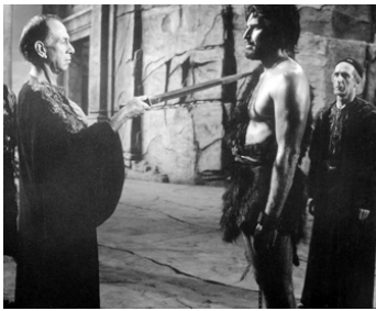
1964 LA PLUS GRANDE HISTOIRE JAMAIS CONTÉE de George Stevens avec Ch. Heston