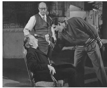
1966 ENTER LAUGHING de Carl Reiner avec Richard Deacon, Reni Santoni