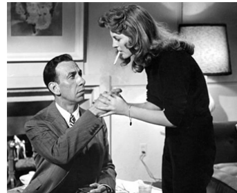
1956 QUAND LE MASQUE TOMBE (The great Man) de J. Ferrer avec Joanne Gilbert, Keenan Wynn