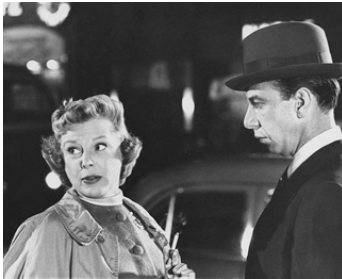
1955 ANGE OU DÉMON (The Shrike) de José Ferrer avec June Allyson