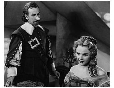
1950 CYRANO DE BERGERAC de Michael Gordon avec Mala Powers