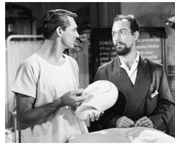
1950 CAS DE CONSCIENCE (Crisis) de Richard Brooks avec Cary Grant