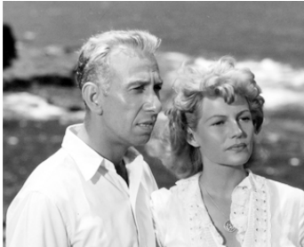
1953 LA BELLE DU PACIFIQUE (Miss Sadie Thompson) de C. Bernhard avec Rita Hayworth