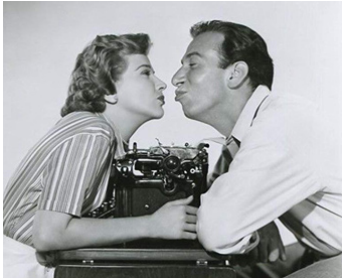
1952 TOUT PEUT ARRIVER (Anything can happen) de George Seaton avec Kim Hunter