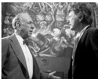
1983 L'ENFER DE LA VIOLENCE (The evil that men do) de J. Lee-Thompson avec Ch. Bronson